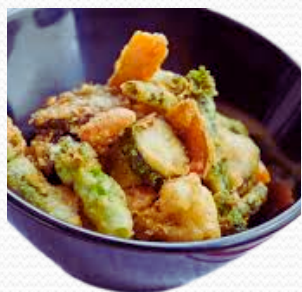
Tempura de verduras (4x2.5kg)