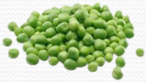
Guisantes (4x2.5kg, bolsa de 1k y bolsa de 400gr.)