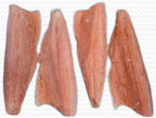
Filete de salmon 800+ (caja 11 kg)