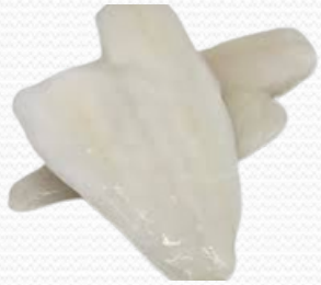
Filete de limanda 90/120 (caja 6x1 kg)