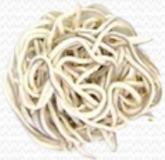
Anguriñas (100+100 gr.)