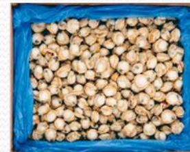
Carne de zamburiña 30/50