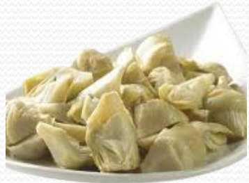
Alcachofa troceada (4x2.5)