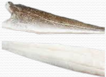
Filete de bacalao 500/1000 de 1º congelación (caja 11 kg)