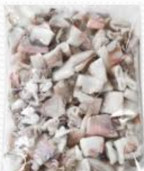
Calamar troceado (6x1 kg)