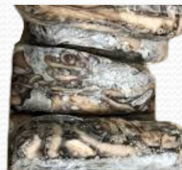
Pulpo roto (caja 20 kg)