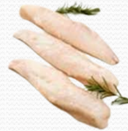
Filete de rape pacifico (caja 6x1 kg)