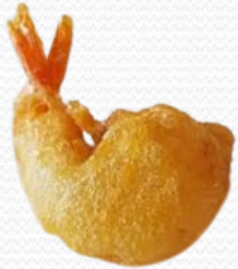
Gamba gabardina (2x1kg)