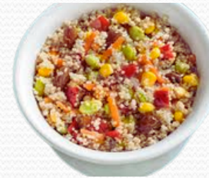
Quinoa con verduras (6X1kg)