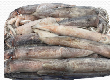
Pota ilex +20 (2x5kg)