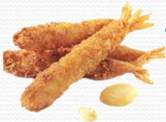
Torpedo de langostino (4x1kg)