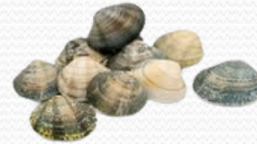
Almeja japónica (6x1 kg)