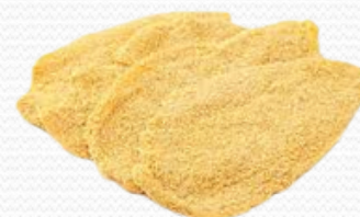
Pechuga de pollo empanado (4x1kg)