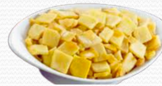
Base de tortilla (6x1kg)