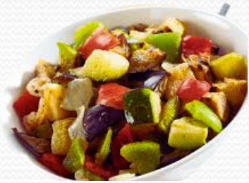
Salteado mediterráneo (caja 6x1kg)