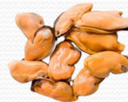
Carne de mejillon gallego G,M,y P Tambien en 1/2 concha