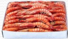
Gamba roja alistada