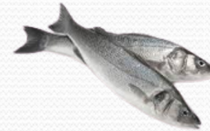
Lubina fresca varios tamaños (caja de 6 kg)