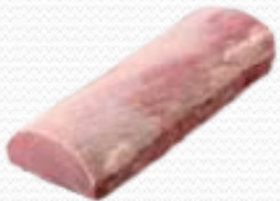
Cinta de lomo de cerdo