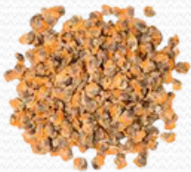
Carne de berberecho (varios tamaños)

20/30 crudo 30/40 crudo 50/60 crudo 40/60 cocido