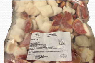
Carde de vieira del pacifico rota (bolsa de kilo)