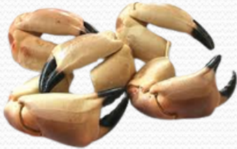
Pinzas de buey