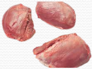
Carrillera de cerdo