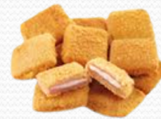
Mini san jacobos (8x500gr.)