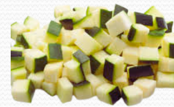
Calabacín dado (4x2.5)