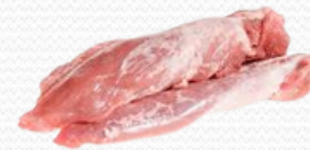
Solomillo de cerdo blanco