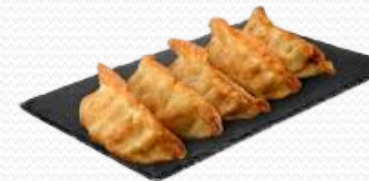
Gyoza (10x20 unid.)