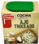
Ajo troceado (12x70gr.)