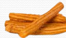
Churro recto (4kg)