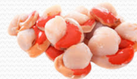
Carne de vieira ( bolsa de kilo)