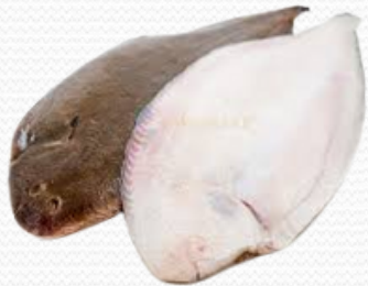
Lenguado 350/400 (caja 5 kg)