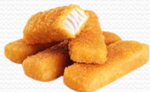
Varitas de merluza (4x1kg y est.300gr.)