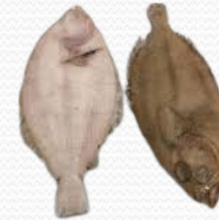
Gallo 300/500 (caja 10 kg)