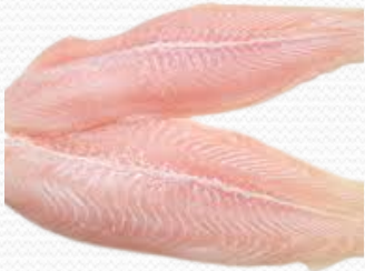
Filete de panga (caja de 6x1 kg)