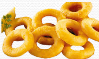
Caprichos de calamar (4x1kg y 10X400gr.)