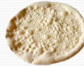
Base de pizza (caja de 10 und.)