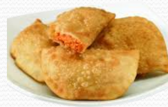
Empanadilla horneable de atún (4x1kg)