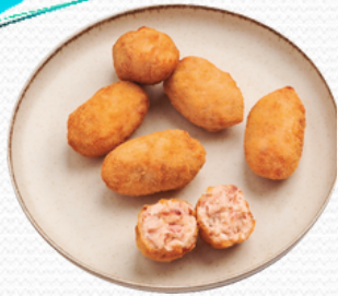
Croquetas de jamón ibérico mesón (4x500gr.)