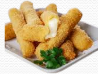
Mozzarella Sticks Palitos de queso (2x1kg)