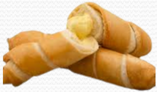
Tequeños de queso Gouda (2 bolsa de 20 und.)