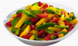
Pimiento tricolor (4x2.5kg)