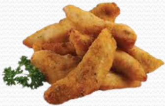
Finger de pollo (8x320gr.)