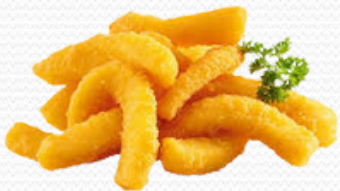
Rabas de calamar (4x1kg)