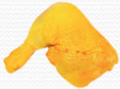
Zancos de pollo amarillo (caja de 5k)