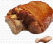
Codillo de cerdo