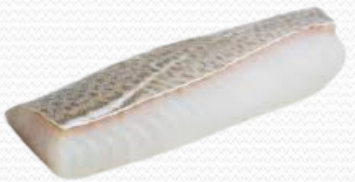
Lomo de bacalao selecto 300+ (caja 5 kg)