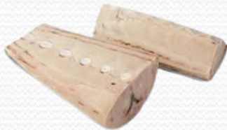
Lomo de pez espada con piel ( envasado al vacío)