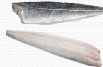
filete de fognero 1000+ anzuelo (caja 11 kg)