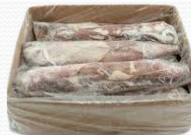
Calamar marruecos env. varios tamaños p, gg (caja de 10k aprox.)