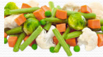
Menestra común (4x2.5kg)