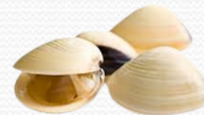
Almeja blanca (6x1 kg)