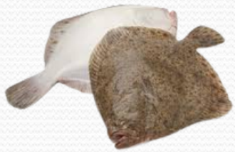
Rodaballo (fresco, varios tamaños) (caja 6kg o 10 kg)