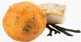
Croqueta de merluza y alga 45gr. (138 un.)