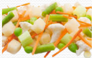
Sopa de verduras (4x2.5kg)