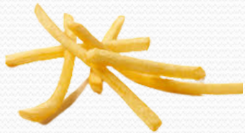
Patata juliene (4x2.5kg)