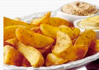
Patata gajo a las finas hiervas (4x2.5kg)