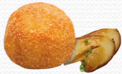
Croqueta de boletus 45gr. (138 un.)