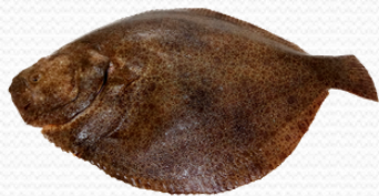
Coruxo eviscerado 300/500 (caja 5 kg)