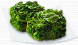
Grelos (caja 10x1kg)