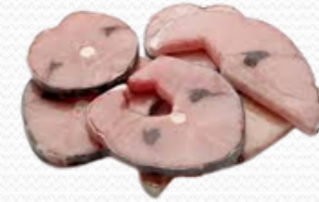
Rodaja de marrajo (caja 7 kg)