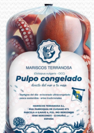
Pulpo 1.5/2 Terranosa (Caja de 20KG)