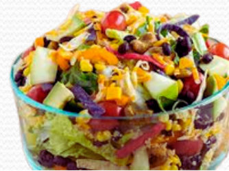
Ensalada mexicana (4x2.5kg)