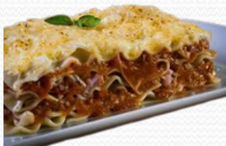
Lasaña con bechamel (3x2kg)