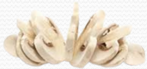
Champiñón laminado (4x2.5kg)