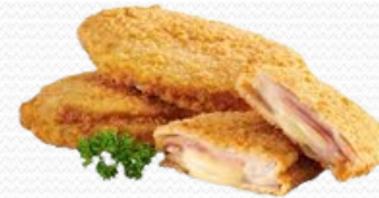
Librito de lomo y queso (4x1kg)