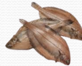
Gallo 100/3000 (caja 10 kg)