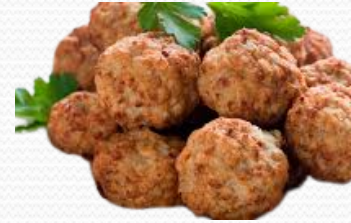
Albóndigas (caja de 3k)