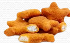
Peskitos de merluza (4x1kg)