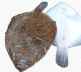
Rodaballo 200/400 (caja 5 kg)