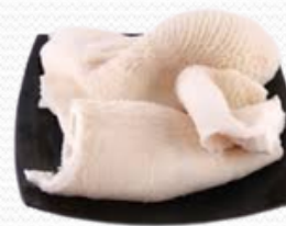
Callos de ternera (vientre) Caja: 10 kg aprox.