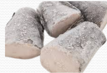
Cola de merluza austral (caja 6x1 kg)