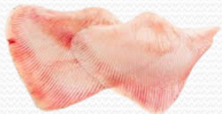
Alas de raya 600+ (caja 10 kg)