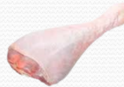
Zancos de pavo