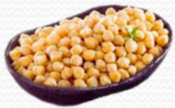
Potaje de garbanzos (caja 10x1kg)