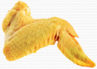
Alas de pollo amarillo (caja de 4k y en bolsa de kilo)