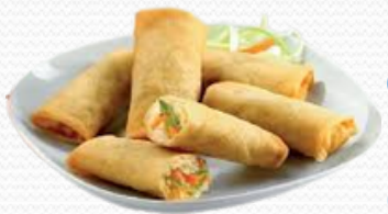
Mini rollito de primavera (4x1kg)