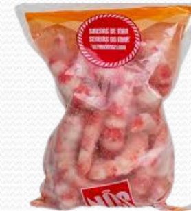
Sirenas de surimi (500gr. x 12)