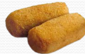
Croquetas de bacalao price (4x1kg)