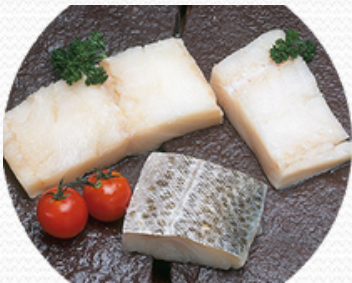
Lomo de bacalao per. punta de sal (caja 7 kg)