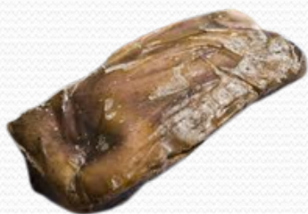
Pulpo t-3 (caja 10 kg)