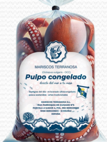
Pulpo 2/3 Terranosa (Caja de 20KG)