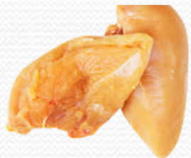
Pechuga de pollo amarillo (caja de 5k)