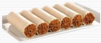
Canelón de carne sin bechamel (4x1)