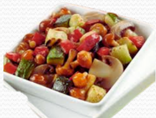
Revuelto de verduras y setas (4x2.5kg)