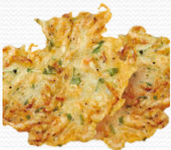
Tortilla de camarón (3x1kg)