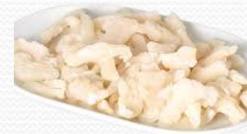
Migas sin piel y sin espina (caja 7 kg)