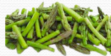
Esparrago trigeros (bolsa de 1kg)