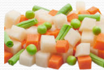
Ensaladilla (bolsa de 1 k y de 2.5 kg)