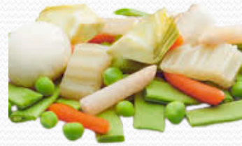
Menestra sin alcachofa (bolsa de 1k)