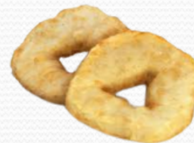
Rodaja de merluza rebozada (4x1kg)