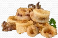
Chipirón enharinado (4x1kg)