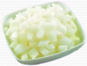
Cebolla dado (caja 4x2.5k)