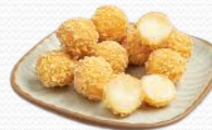
Bites de gouda (3x1kg)