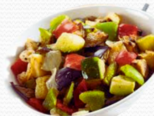
Pisto de verduras (4x2.5kg)