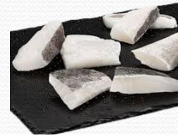
Pizcas de bacalao (caja 4 kg)