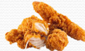
Chicken Strips (tiras de pollo al natural) (3x1kg)