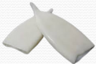
Tubo de pota (varios orígenes y formatos, 6x1 kg y 7kg interfoliado)