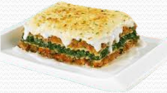
Lasaña vegetal (12x300gr.)