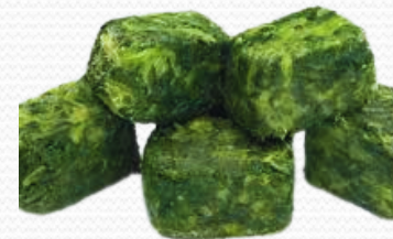
Espinaca porciones (bolsa de 1k y de 2.5kg)