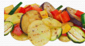
Parrillada campestre (6x1kg)