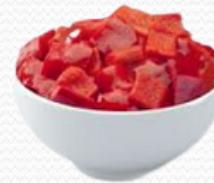
Pimiento rojo (4x2.5kg)