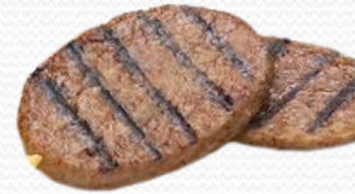
Hamburguesa (caja de 3k)