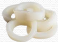
Anilla de calamar (varios formatos, 6x1 kg y 6kg granel)