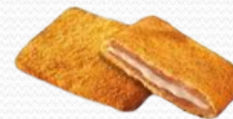
San jacobos (3x1kg)