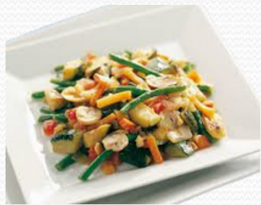
Salteado tradicional (caja 6x1kg)