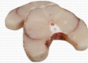
Rodaja de caella (caja 6 kg)