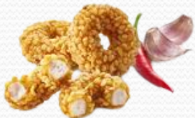
Chicken Rings (3x1kg)