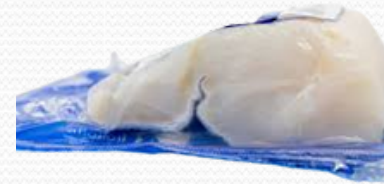
Lomo bacalao 300/400 (caja 6 kg)