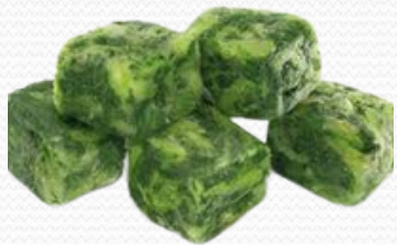
Acelgas (caja 10k)