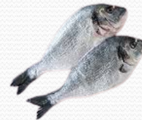
Dorada fresca varios tamaños (caja de 6 kg)