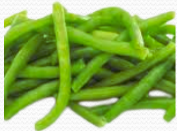
Judía redonda (4x2.5 y bolsa de 1k)