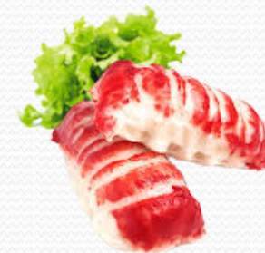
Delicias de surimi varios tamaños (250gr.x24)