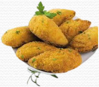
Mejillón relleno (bolsa de 500 gr.)