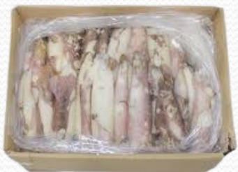
Chipirón patagónico n4 10-12 cm (5 kg)