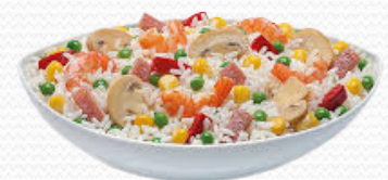
Arroz 5 delicias (caja de 10k)