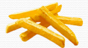
Patata steak house (4x2.5kg)