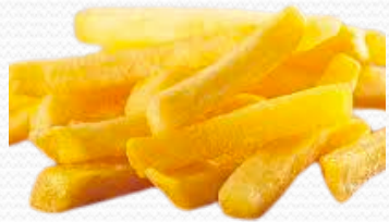
Patata 3/8 (caja 10x1kg)