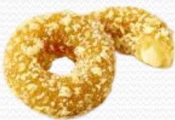
Gouda Rings (3x1kg)