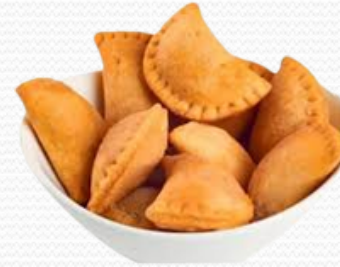
Mini empanadilla de atún (4x1kg)