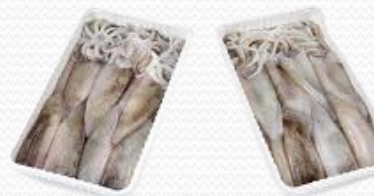
Chipirón limpio con piel (6x1 kg)