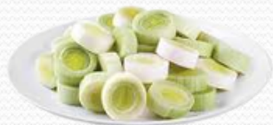
Puerro en rodaja (4x2.5kg)