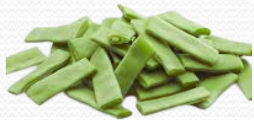
Judía plana (4x2.5 y bolsa de 1k)