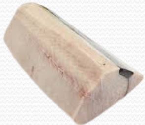
Lomo de marrajo ( envasado al vacío)