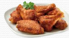
Alas de pollo barbacoa ( caja 5kg)