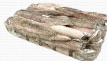
Chipirón patagónico II-14 cm (caja 6 kg)