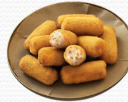
Croquetas artesanas de jamón (4x1kg)