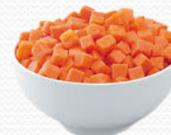
Zanahoria dado (4x2.5kg)