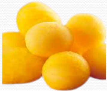
Patata parisina (4x2.5kg)