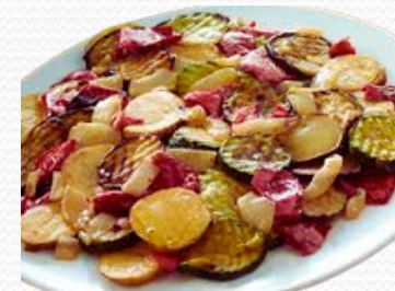
Mezcla verduras a la parrilla (6x1kg)