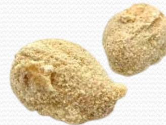
Croquetas de huevos con chorizo (6x500gr.)