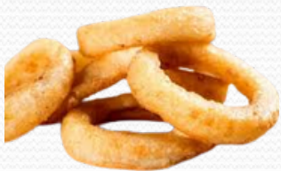
Aros de cebolla rebozados (4x1kg)