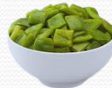
Pimiento verde (4x2.5kg)