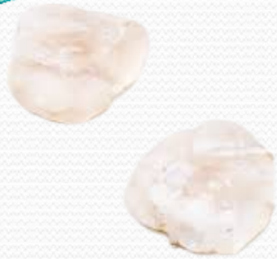
Cocochas de rape de gran sol (caja 1 kg)