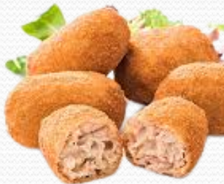
Croquetas de cocido (4x1kg)