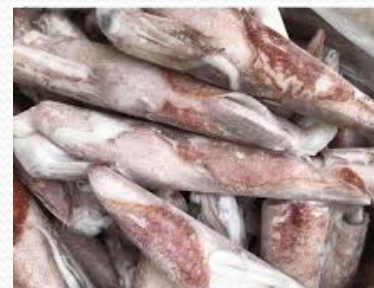
Calamar Holanda varios tamaños 300/500 y 500/1000 (caja de 10k )