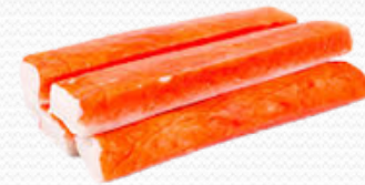
Palitos de surimi (caja 10x1 kg , 20x250gr. y 10x450 gr)