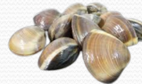
Almeja marrón (6x1 kg)