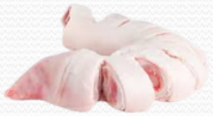
Pata de ternera