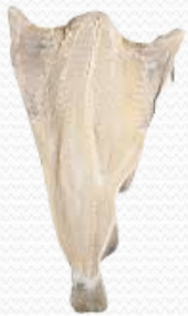
Bacalao abierto (caja 20 kg)