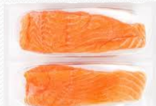
Lomo de salmón salar (caja 20x250gr)