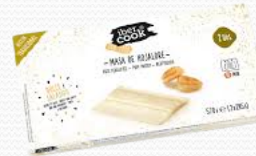
Masa de Hojaldre (13x570 gr.)