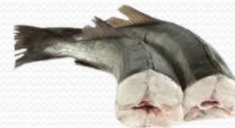
Merluza austral pincho varios tamaños (caja 15 kg)