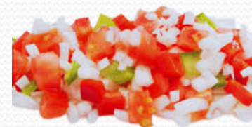
Verduras para sofrito (4x2.5kg)