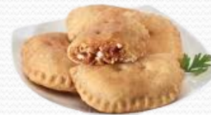
Empanadilla horneable de carne (4x1kg)