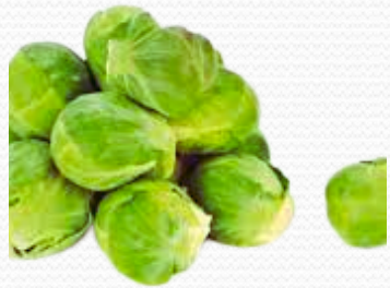
Coles de Bruselas (4x2.5)