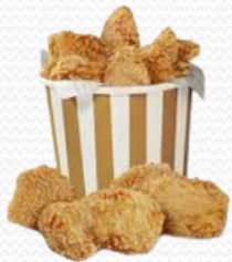
Pollo estilo Kentucky (3x1kg)