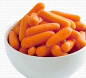
Zanahoria baby (4x2.5kg)