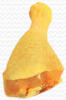
Jamoncito de pollo amarillo (caja de 5k)