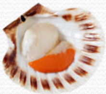
Vieria ½ concha limpia 8/12 pzas 12/14 cm