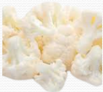
Coliflor (bolsa de 1kilo y de 2.5 kg)