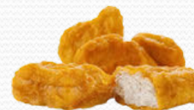
Nuggets de pollo (8x500gr.)