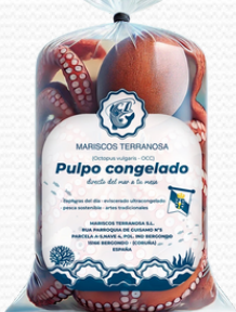
Pulpo 2/3 Terranosa (Caja de 20KG)