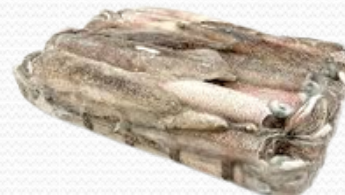
Chipirón patagónico II-14 cm (caja 6 kg)