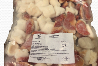
Carde de vieira del pacifico rota (bolsa de kilo)