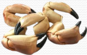
Pinzas de buey