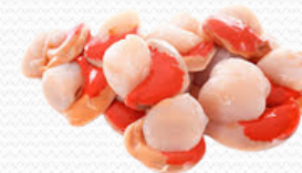
Carne de vieira ( bolsa de kilo)