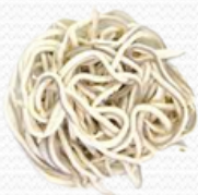
Anguriñas (100+100 gr.)