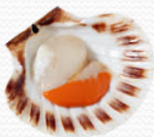
Vieria ½ concha limpia 8/12 pzas 12/14 cm